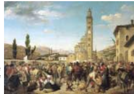
La fiera a Madonna di Tirano. A. Caimi, 1860.