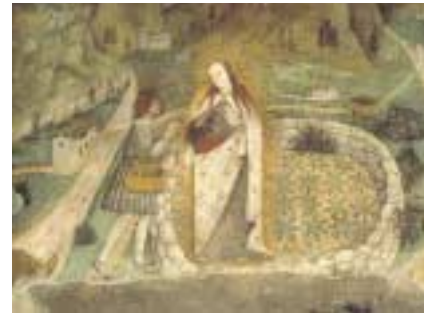
Affresco, 1513 (nel Santuario).